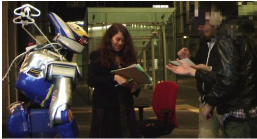
Fig. 1 Photographs indicating different behaviors of the HRP-2 during the experiment.

Participants' faces are censored in order to preserve their anonymity. Upper left: handshake; upper right: wave; lower left: bow.